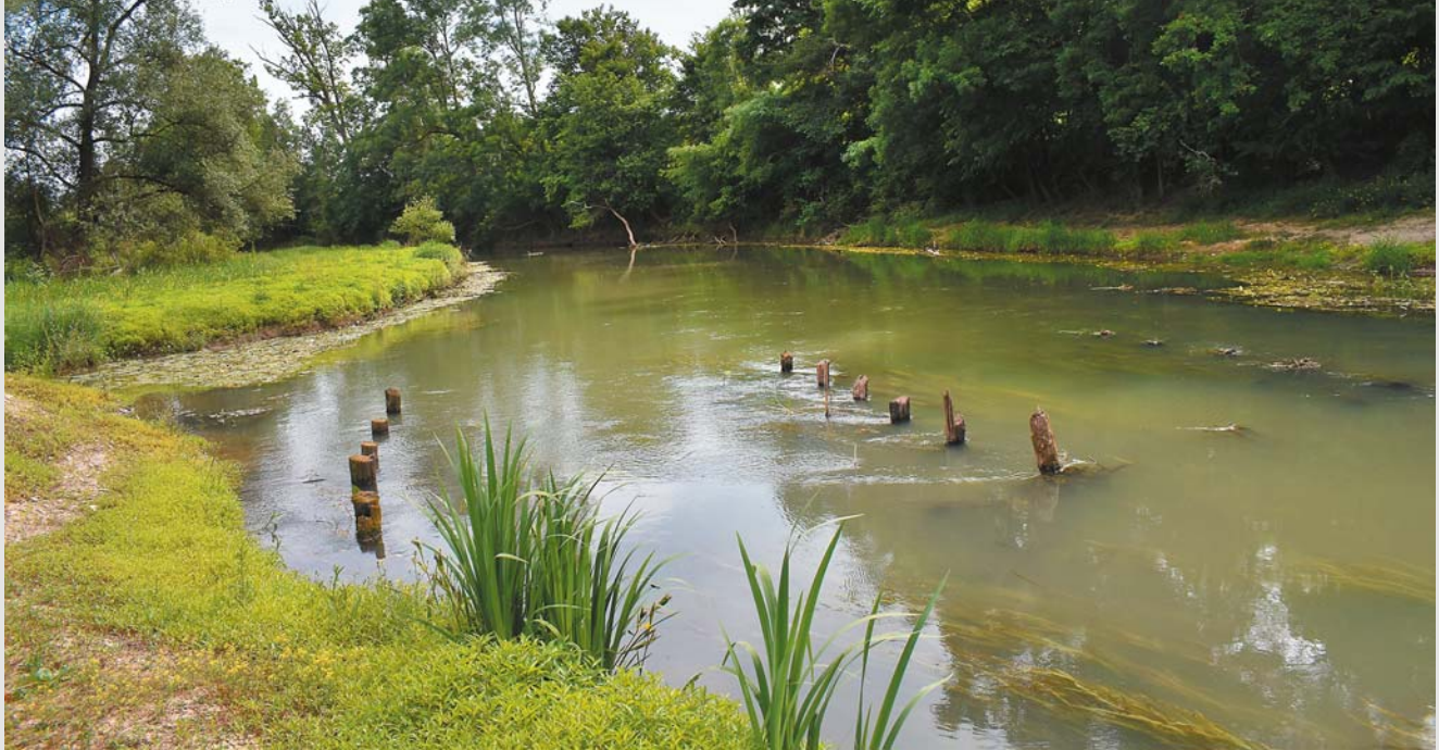
Odra Selecki most – pozostałość