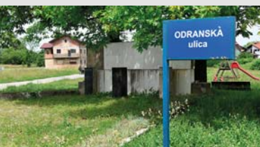
Žabno, ulica Odranska