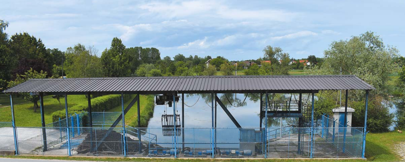
↑ Syfon na Odrze obok miejscowości Čička Poljana