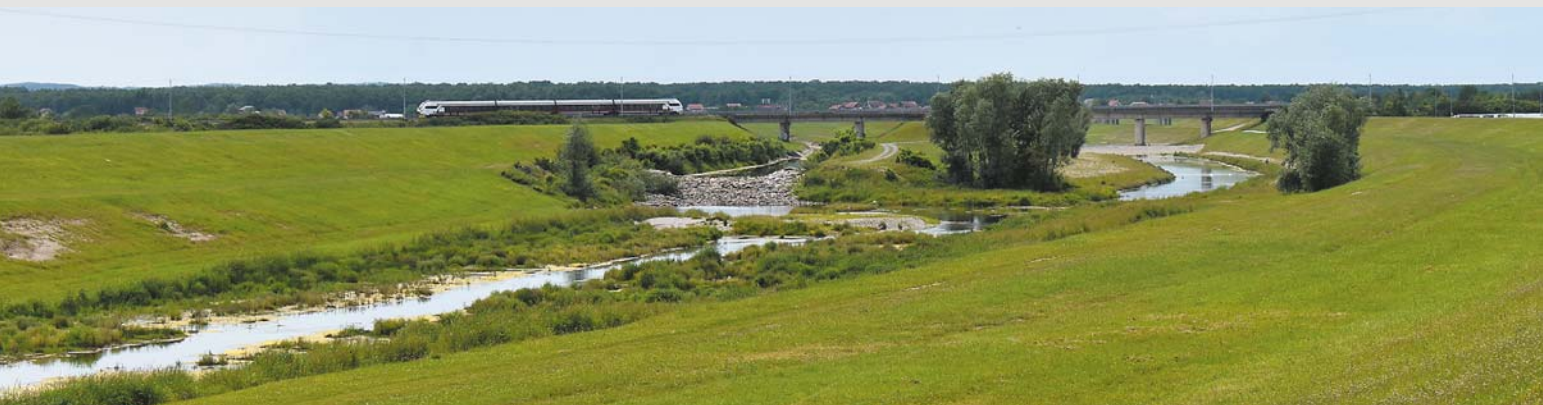
Ujście rzeki Lomnicy (po lewej stronie) do kanału Sava-Odra

największego prawego dopływu Dunaju (2888 km). Z kolei wody Dunaju, drugiej co do wielkości rzeki w Europie (po Woltze), wpływają rozległą deltą do Morza Czarnego.