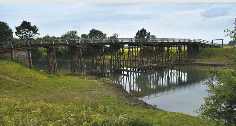
Greda polje, drewniany most