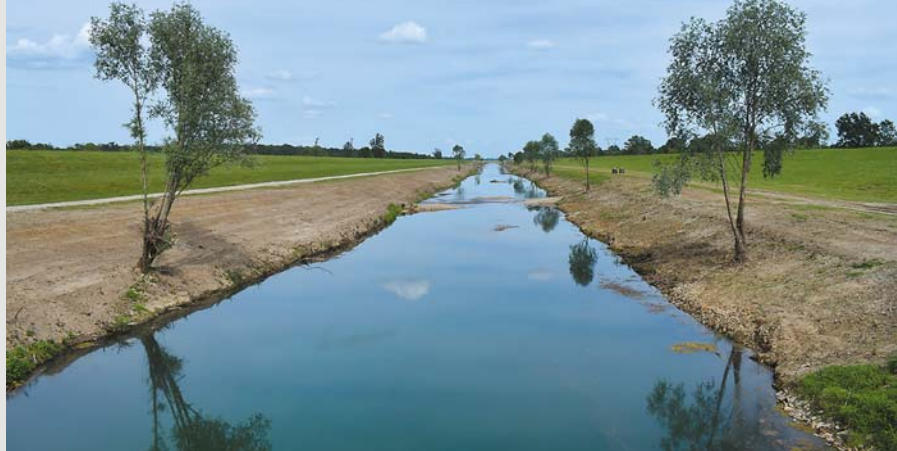
Kanal Sava-Odra na wysokości Kućkiego mostu