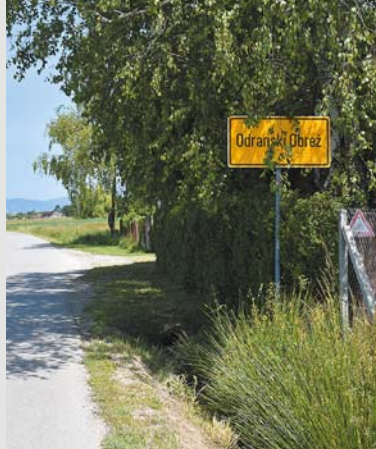
Odranski Obrež – jedno z osiedli Zagrzebia