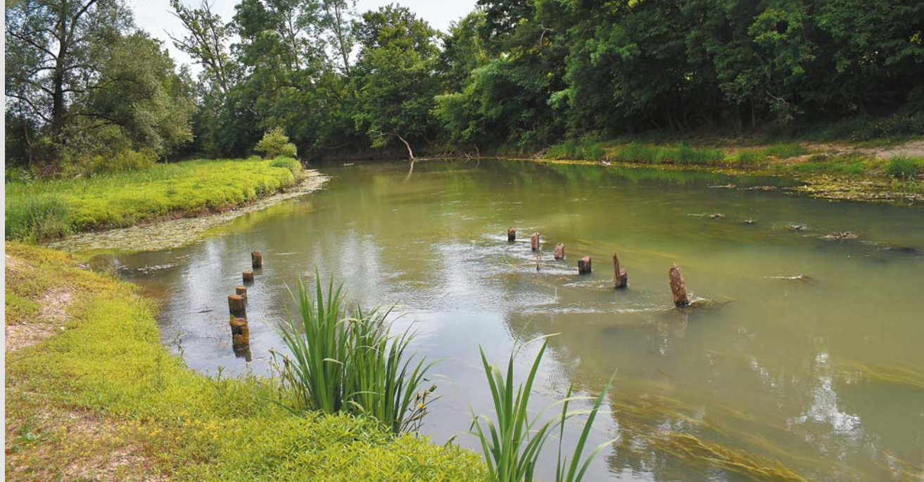
Odra Selecki most – pozostałość