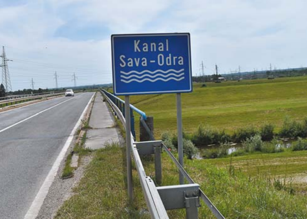
Most na kanale Sava-Odra na wysokości miejscowości Vukovina