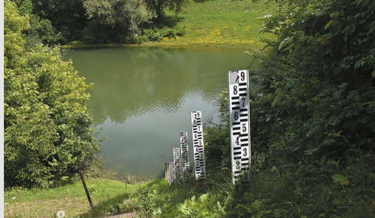
Odra Sisačka, wodowskaz wodny