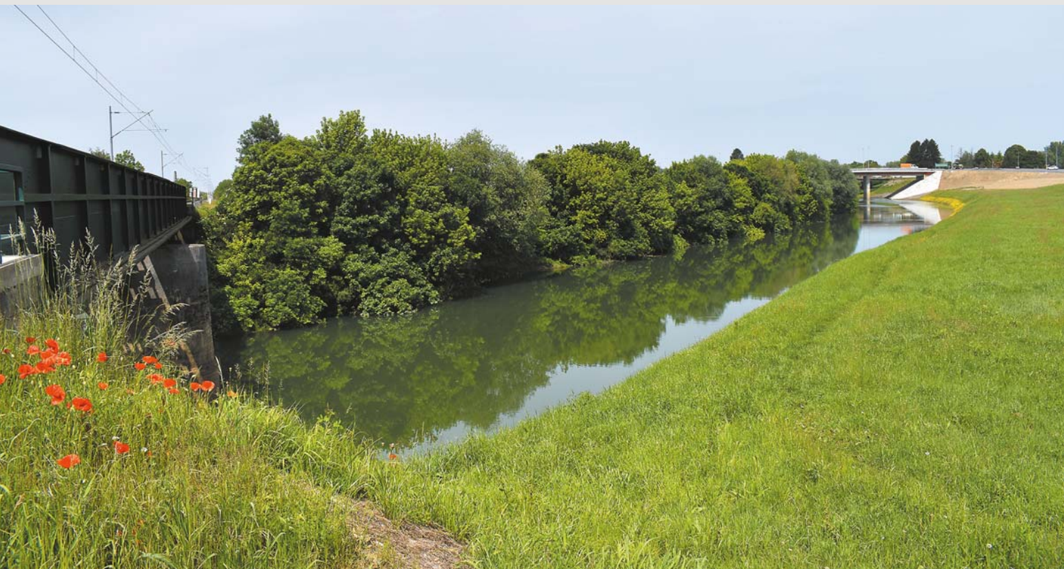
↓ Odra między mostem kolejowym a nowym mostem drogowym w Sisaku