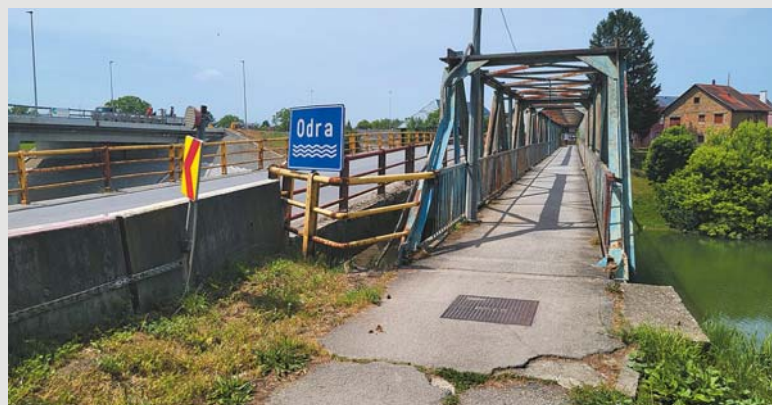
Sisak, stary i nowy most drogowy oraz most dla pieszych

Na kontynencie europejskim płyną cztery rzeki o nazwie Odra. Najdłuższa z nich przepływa przez Czechy, Polskę i Niemcy (854 km), drugą jest chorwacka Odra (82,7 km), następnie hiszpańska Rio Odra (65,5 km), a najkrótszą jest ta na Ukrainie w rejonie semieniewskim, w obwodzie czernihowskim, która liczy zaledwie 14 km i leży kilkadziesiąt kilometrów od granicy z Rosją. Ponadto istnieje Odrava znajdująca się w zachodnich Czechach oraz rzeka Oder w Dolnej Saksonii w Niemczech.