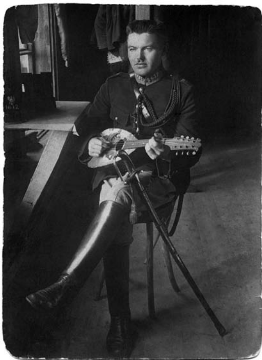
Na granicy polsko-litewskiej w KOP, 1925

11 listopada zwolniony z więzienia na mocy amnestii*. Ochotniczo wstąpił do Armii Andersa. Po prawie sześcioletniej tułaczce 11 lutego 1947 wrócił z Anglii do Gdyni, gdzie mieszkała jego najbliższa rodzina od września 1946 roku. Na początku maja 1947 roku przeniósł się z rodziną do Wrocławia.