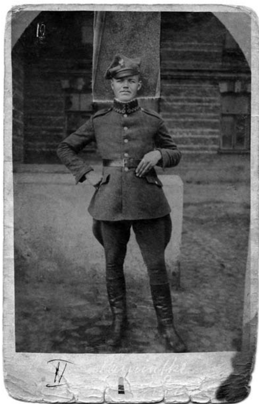
Ochotnik i uczestnik wyzwolenia Warszawy (Cud nad Wisłą), 1918–1921

28 lutego 1941 został aresztowany przez NKWD spod Nowych Trok, potem osadzony w więzieniu na Łukiszkach w Wilnie. 24 czerwca przewieziony do więzienia w Gorkach koło Moskwy.